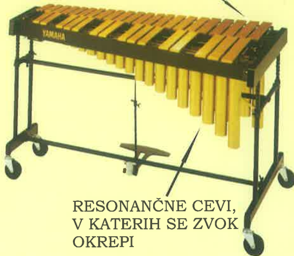
RESONANČNE CEVI, V KATERIH SE ZVOK OKREPI